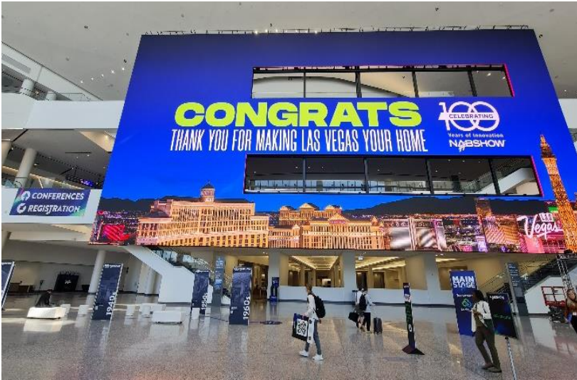
West-Hall: Eine Riesenhalle braucht auch einen Riesen-Screen (fast 3 Stockwerke, sehr «Grün» ist der wohl nicht 😊)