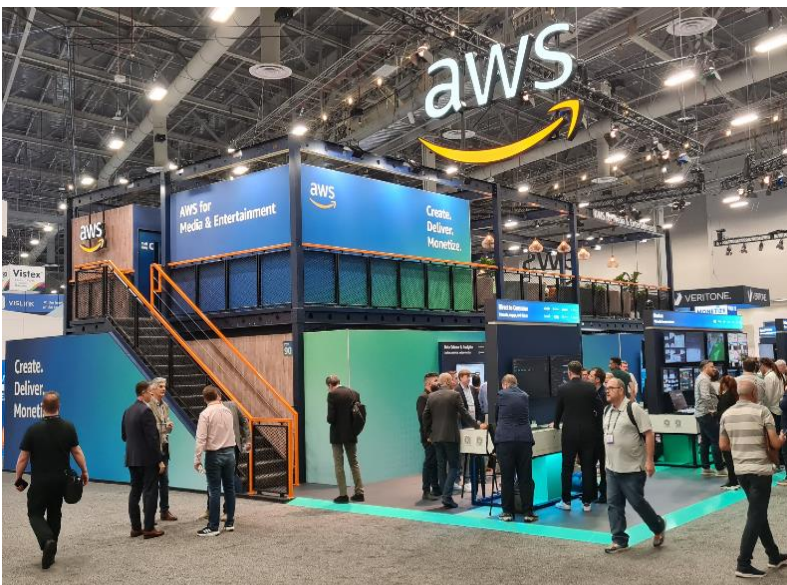
AWS (Amazon Web Services) neben Stand noch extrem viel Sponsoring von Ausbildungs- und anderen Programmen.