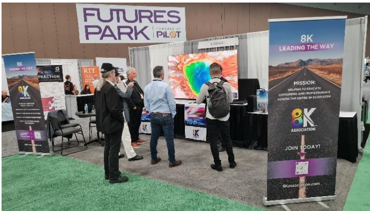
Kleiner 8KTV «Blitzer» im FuturePark