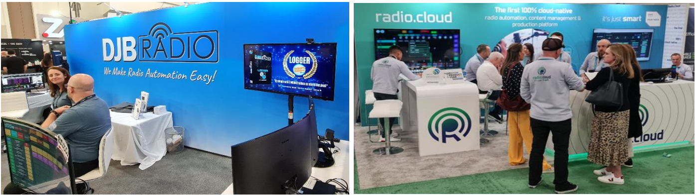
4 Beispiele von Cloud-/Virtuellen- Anbieter , BJB , radio.cloud, backbone und IP-Studio