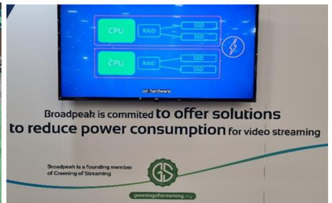
Greening of Streaming is an organisation created to address growing concerns about the energy impact of the streaming sector.