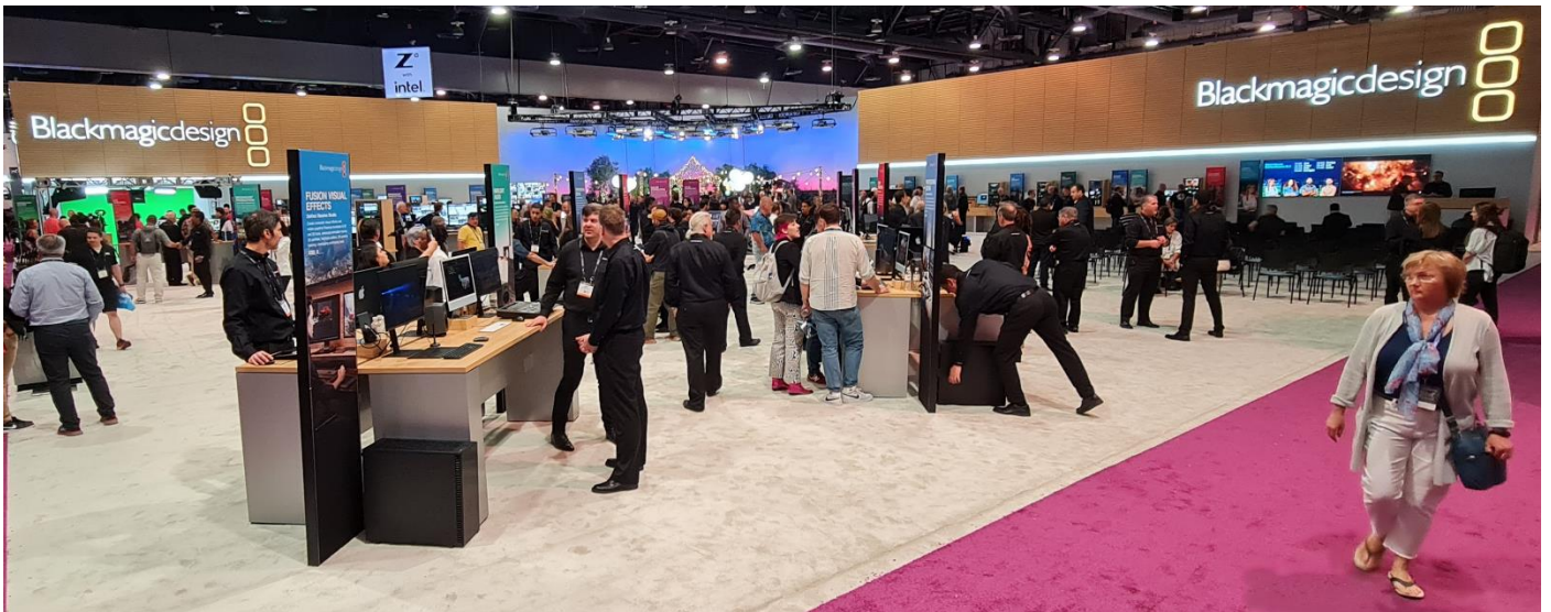
Gross, grösser, am grössten und sehr viel los bei Blackmagicdesign und bei CANON