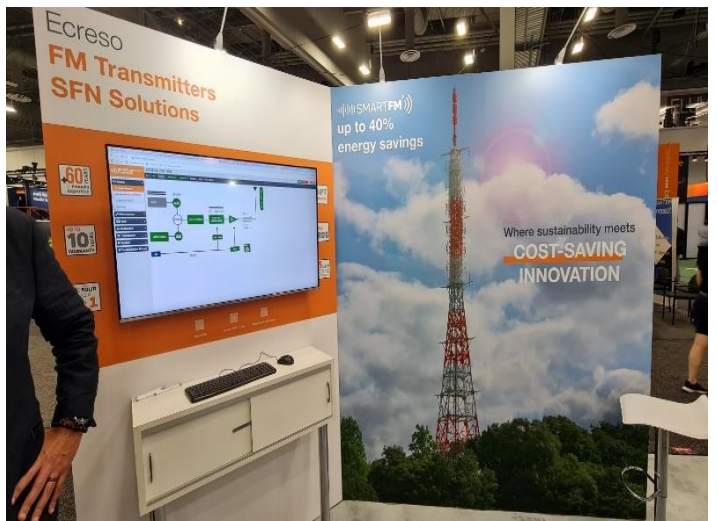
NAUTEL aus Kanada hat diversifiziert! (FM-DAB+ IP) ESCRESO mit dem «bis zu 40%» Stromsparangebot