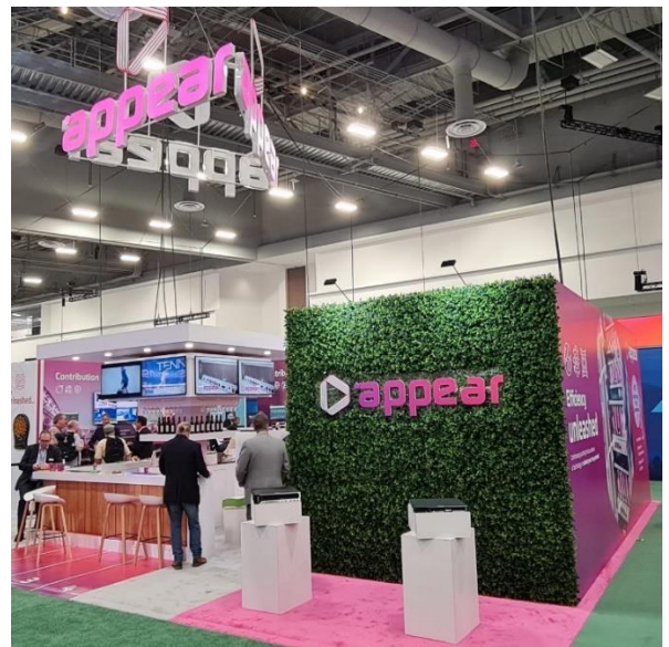
appear TV mit leichtem Grün-Touch 😊