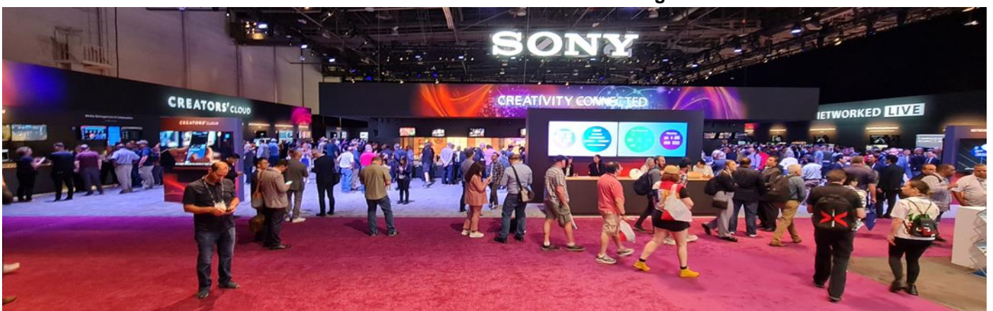
SONY am üblichen Ort und wieder in der alten Grösse in «hinten links in der Central Hall»