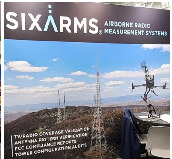
Funk-Vermessung mit Drohnen von Sixarms Hat noch keinen zertifizierten CH-Operator!