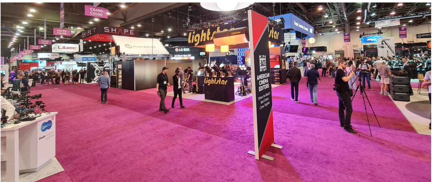
Deutlich sichtbar (Beispiel aus der Central Hall) die neue lockere Platzaufteilung