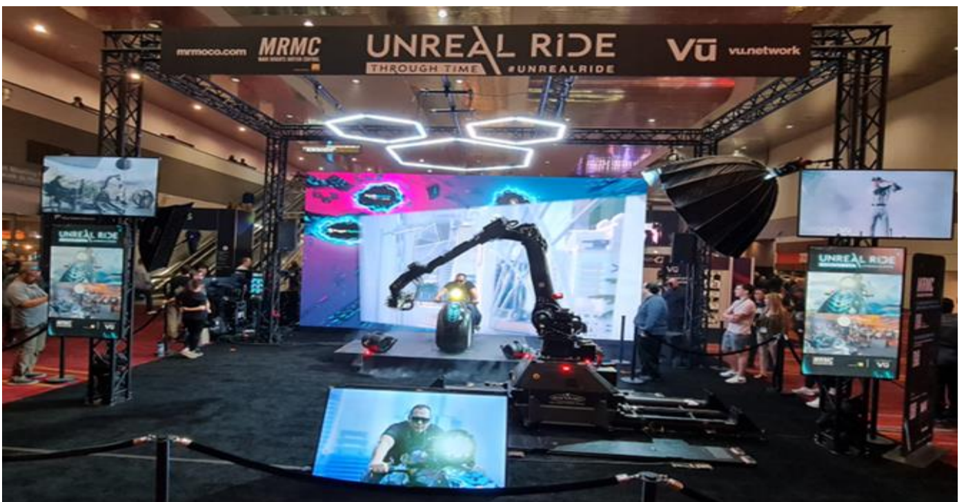
A motion control & virtual production collaboration between MRMC & VU Studio at NABshow , der Riesen Hingucker im Bereich zwischen Nord- und Central Hall