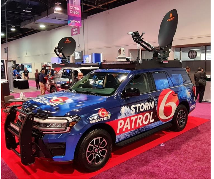
Schön, dass es doch auch noch echte Hardware neben allem Virtuellen und Software gibt und braucht! 😊